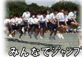
みんなでジャンプ