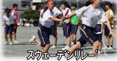
スウェーデンリレー