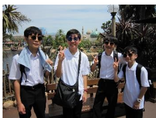
2日目（ディズニーシー）