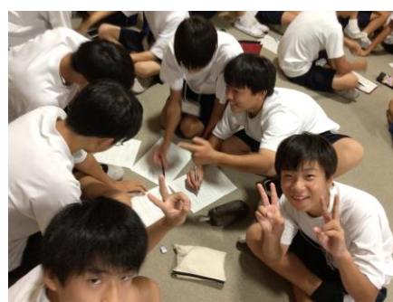
【リフレーミングの様子②】