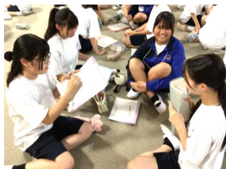
【リフレーミングの様子①】