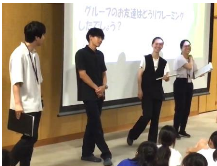
【リフレーミングの教師寸劇】

生徒の感想には、「自分の短所をリフレーミングすることでポジティブに考えることが自分らしく生きるのに大切なことだと思った」「みんなと話し合いながらポジティブに考えることによって少し心が軽くなったなと思いました」などという記述がありました。