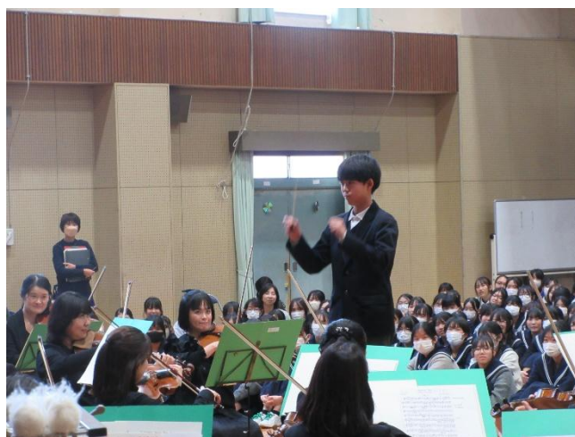
2年生代表の指揮者体験