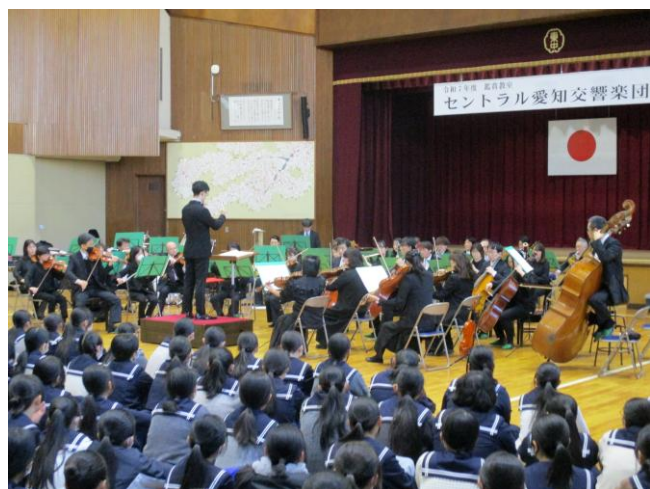
すぐ目の前での演奏

セントラル愛知交響楽団をお招きして、3年に1度の公演会が飛翔館でおこなわれました。生徒たちのすぐ目の前で演奏するオーケストラの迫力に、生徒たちは目を輝かせて聞き入っていたようです。演奏の合間には、様々な楽器の紹介を紹介しながら、ゲームやCMなどで耳にしたことのあるメロディーを聞かせてもらったり、代表の生徒が指揮者体験をさせてもらったりして、楽しく和やかな時間を過ごすことができました。