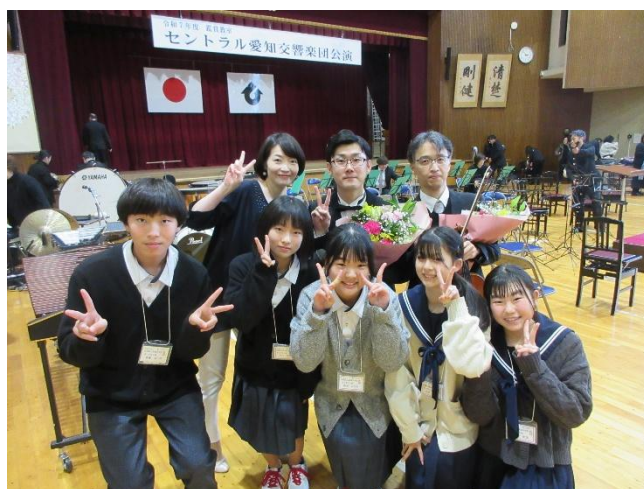
楽団の方と進行役の生徒会のみなさん