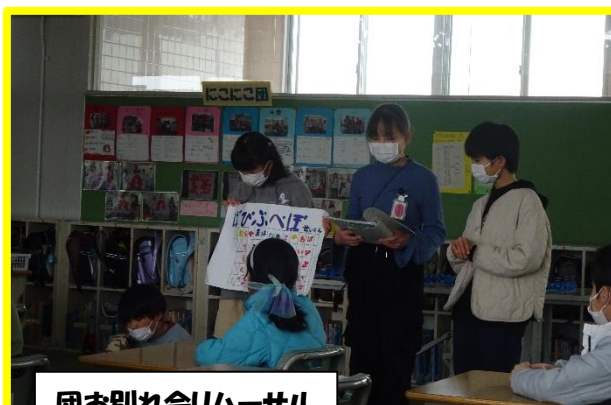
団お別れ会リハーサル