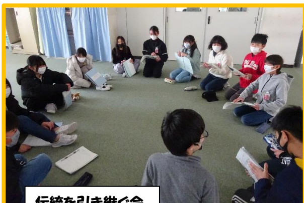
伝統を引き継ぐ会